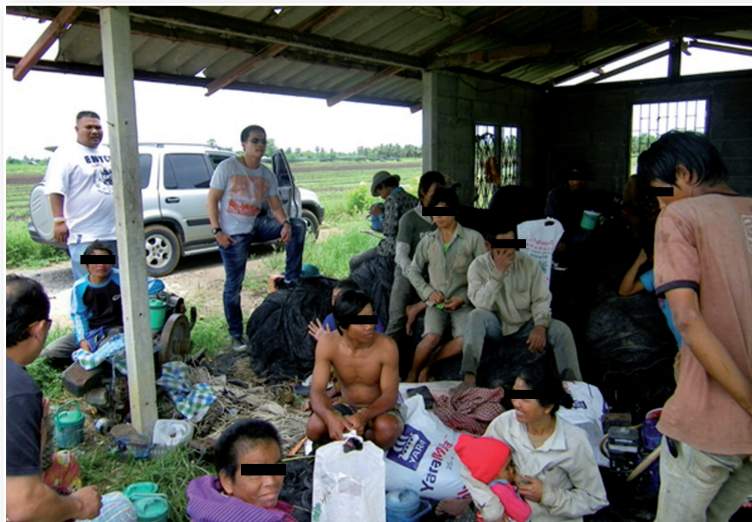
๔ ภาพจากกองบังคับการปราบปรามการกระทำความผิดเกี่ยวกับการค้ำมนุษย์

ประโยชน์ของพระราชบัญญัติสถานบริการฯ นั้นมีมากมาย ทั้งคอยควบคุมเจ้าของ ผู้ดูแล พนักงานเจ้าหน้าที่ตำรวจที่จะเข้าไปในสถานบริการและบุคคลภายนอกที่เกี่ยวข้องกับสถานบริการ และยังคงคุ้มครองการกระทำผิดต่างๆ ในร้านไม่ว่าจะเป็นเรื่องยาเสพติด ค้าประเวณี อาวุธปืนฯ แต่ทั้งนี้ มีผู้ประกอบการจำนวนมากที่เสี่ยงไม่ยอมขออนุญาตเปิดสถานบริการ คงยินยอมให้จับกุมในข้อหาเปิดสถานบริการโดยไม่ได้รับอนุญาตเท่านั้น