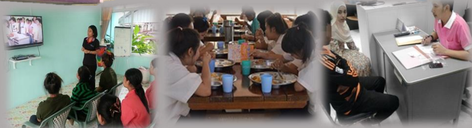
ការណែនាំតម្រង ទិស