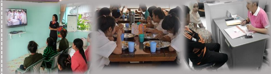
การประชุมนิเทศ