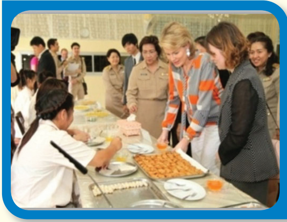
เจ้าหญิงมาทิลด์แห่งราชอาณาจักรเบลเยียม