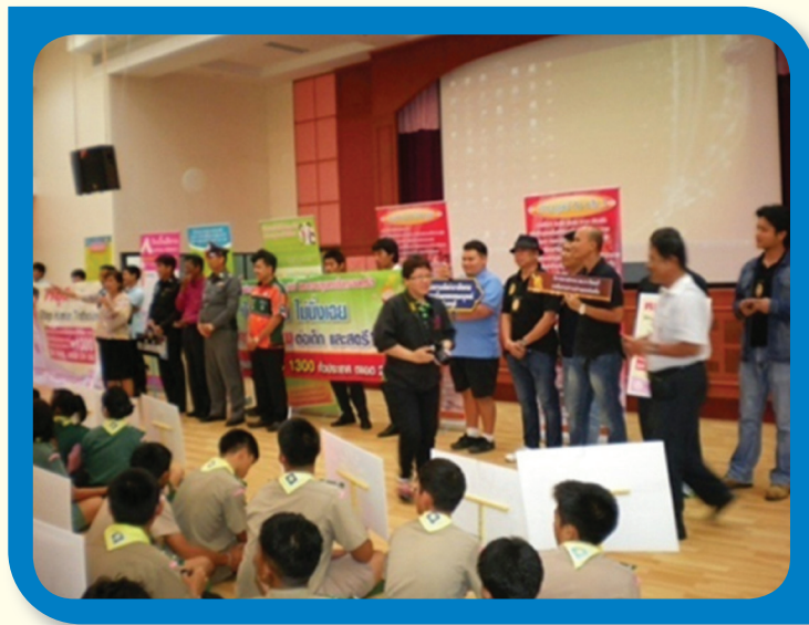
มีการรณรงค์ให้ความรู้ และแจกจ่ายแผ่นพับประชาสัมพันธ์การค้ามนุษย์ในกลุ่มเด็ก

3.5.2 ได้จัดวันรณรงค์ต่อต้านการค้ามนุษย์ ประจำปี 2556 โดยมีกิจกรรมที่หลากหลาย เช่น รณรงค์ติดเข็มกลัดรณรงค์ต่อต้านการค้ามนุษย์ จัดทำสโปตวิทยุ / โทรทัศน์ สื่อสิ่งพิมพ์ แผ่นพับ การมอบโล่รางวัลเพื่อเชิดชูเกียรติสำหรับผู้ปฏิบัติงาน หน่วยงาน และสื่อมวลชน ที่มีผลงานดีเด่นด้านการป้องกันและปราบปรามการค้ามนุษย์ เป็นต้น นอกจากนี้ ยังได้ขยายการจัดงานให้ครอบคลุมพื้นที่ทั้ง 77 จังหวัด ทั่วประเทศ โดยสนับสนุนงบประมาณให้ศูนย์ปฏิบัติการป้องกันและปราบปรามการค้ามนุษย์จังหวัด จัดงานวันรณรงค์ต่อต้านการค้ามนุษย์ให้เหมาะสมกับสถานการณ์ในพื้นที่ โดยมีวัตถุประสงค์เพื่อให้ประชาชนทั่วไป มีความรู้ความเข้าใจ ตระหนักรู้ และกระตุ้นการมีส่วนร่วมของประชาชนในการ เฝ้าระวังและป้องกันแก้ไขปัญหาการค้ามนุษย์