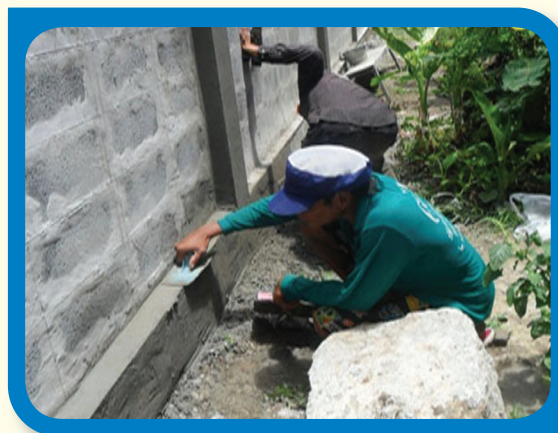
การสนับสนุนประกอบอาชีพงานก่อสร้างอาคารที่พักเจ้าหน้าที่ จังหวัดปทุมธานี