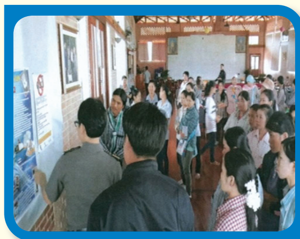
การจัดทำป้ายประชาสัมพันธ์ติดไว้ในห้องกัก