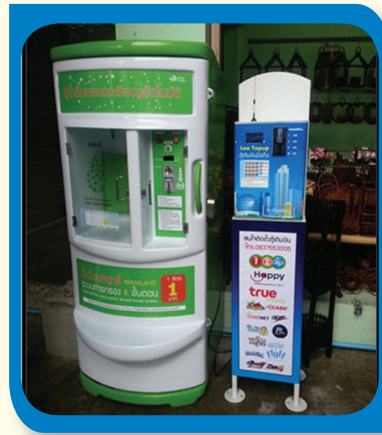
การสนับสนุนให้ประกอบอาชีพตู้เติมเงินและตู้จำหน่ายเครื่องดื่ม จังหวัดกรุงเทพฯ