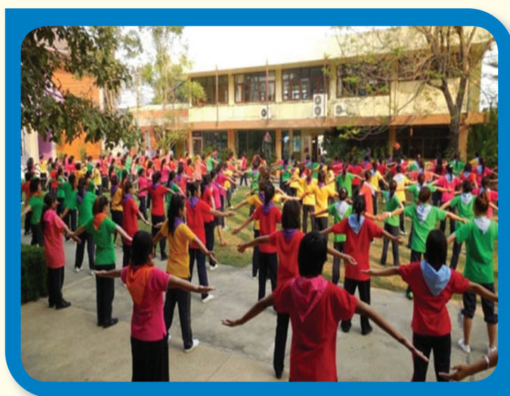
กิจกรรมสันทนาการ

ในปี 2556 ประเทศไทยได้จัดให้มีการเยียวยาให้แก่ผู้เสียหายอย่างน้อย 681 คน สำหรับประเภทหรือลักษณะของการเยียวยา ขึ้นกับสภาพของผู้เสียหาย โดยสถานคุ้มครองมีที่มสวิชาชีพ ซึ่งประกอบด้วย แพทย์ จิตแพทย์ นักจิตวิทยา นักสังคมสงเคราะห์ ร่วมดำเนินการ นอกจากนี้สถานคุ้มครองยังได้จัดกิจกรรมบำบัดสำหรับผู้เสียหาย ได้แก่ ศิลปะบำบัด (art therapy) กลุ่มบำบัด (group therapy) สำหรับผู้เสียหายคนไทยที่กลับสู่ครอบครัว ภูมิลำเนา กระทรวงการพัฒนาสังคมและความมั่นคงของมนุษย์ ได้จัดกิจกรรมโครงการเสริมพลังจากเครือข่ายเพื่อนช่วยเพื่อน