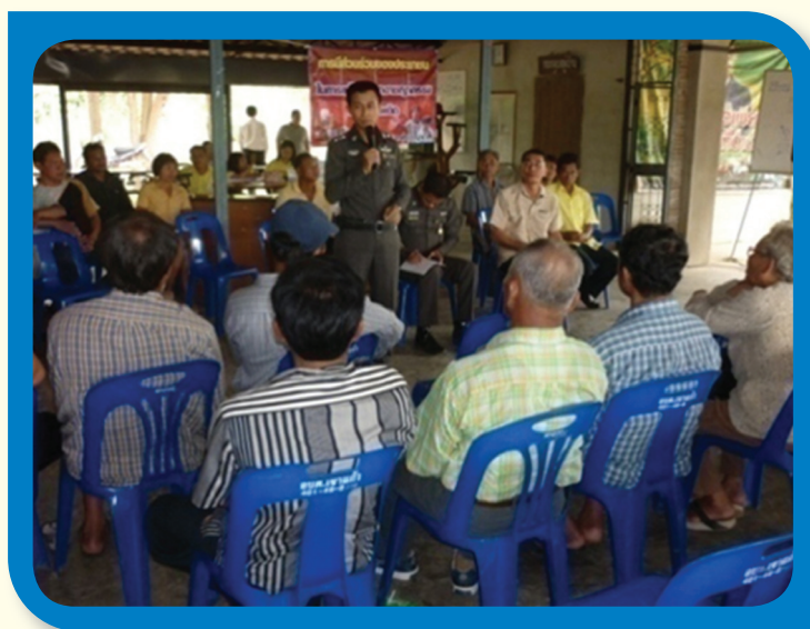
การประชาสัมพันธ์ให้ความรู้แก่ประชาชน

3.5.1 จัดเวทีชุมชน เวทีสาธารณะ และเสริมสร้างความรู้ให้ประชาชนกลุ่มเป้าหมาย เช่น เด็ก สตรี และแรงงานไทยในพื้นที่เสี่ยง ที่ประสงค์ไปทำงานต่างประเทศ ให้มีความพร้อม ความเข้าใจ เรื่องการแสวงหาประโยชน์โดยมิชอบ วิธีการค้ามนุษย์ ความเข้าใจในวิถีการดำเนินชีวิต เมื่อไปใช้แรงงานในต่างประเทศ รวมทั้งวิธีการไปทำงานในต่างประเทศอย่างถูกกฎหมาย นอกจากนี้ มีการเพิ่มช่องทางให้บริการแก่คนหางานมากขึ้น ที่ผ่านมา กระทรวงแรงงานได้มีการประชาสัมพันธ์เผยแพร่ข้อมูลข่าวสารเกี่ยวกับการเดินทางไปทำงานต่างประเทศ ให้บริการข้อมูลแก่คนหางานและผู้รับอนุญาตทำงาน จำนวน 670,801 คน