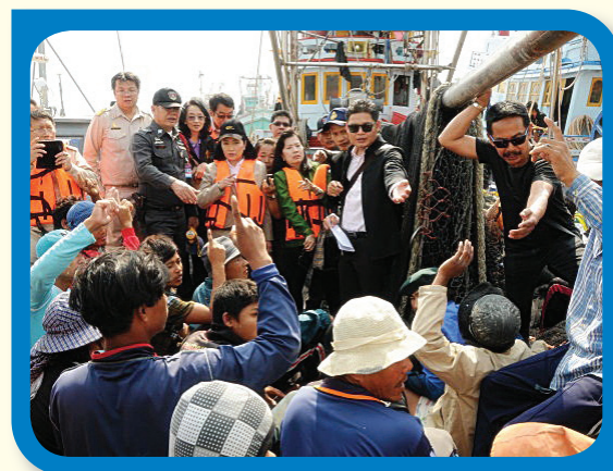
การปฏิบัติงานของเจ้าหน้าที่ในการเข้าตรวจแรงงานในเรือประมง

3.2.4.2 นำร่องตรวจบูรณาการสถานประกอบกิจการที่มีการใช้แรงงานต่างด้าวจำนวนมาก โดยชุดปฏิบัติการส่วนกลางลงพื้นที่ที่ตรวจร่วมกับชุดปฏิบัติการเฉพาะกิจ ตรวจสภาพการจ้าง สภาพการทำงานและการค้ามนุษย์จังหวัดสมุทรสาคร และหน่วยงานที่เกี่ยวข้อง โดยการสุ่มตรวจสถานประกอบกิจการ รวม 10 แห่ง ผลการตรวจพบว่า ลูกจ้างแรงงานต่างด้าวไม่มีใบอนุญาตทำงาน และไม่มีเอกสารหนังสือเดินทาง จำนวน 77 ราย ซึ่งได้แจ้งความดำเนินคดีกับนายจ้าง และประสานส่งต่อหน่วยงานที่เกี่ยวข้องดำเนินการต่อไป ทั้งนี้ ทีมสหวิชาชีพซึ่งได้เข้าไปร่วมตรวจบูรณาการในครั้งนี้ ไม่พบว่ามี การบังคับใช้แรงงาน