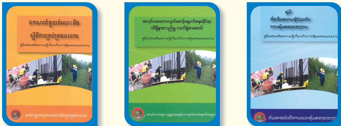
คู่มือส่งเสริมความรู้เกี่ยวกับการคุ้มครองแรงงาน ภาษากัมพูชา เมียนมา และลาว

3.4.1.3 การคุ้มครองแรงงาน โดยได้กำหนดให้มีการดำเนินการดังนี้ (1) จัดทำ สัญญาจ้างมาตรฐานแรงงานประมงทะเลเป็นภาษาของแรงงานต่างด้าว 3 ภาษา (2) ให้ความรู้เรื่องสิทธิ หน้าที่ของนายจ้าง ลูกจ้าง และความปลอดภัยในการทำงาน อาชีวอนามัยและสภาพแวดล้อมในภาคประมง ทะเล โดยได้จัดพิมพ์คู่มือความปลอดภัยในการทำงานในเรือประมงแล้วจำนวน 1,000 เล่ม (3) จัดทำแผน ตรวจสอบแรงงานในเรือประมงทะเลแบบบูรณาการระหว่างหน่วยงานที่เกี่ยวข้อง (4) ส่งเสริมให้นายจ้างมี แนวปฏิบัติการใช้แรงงานที่ดีในภาคประมงทะเล (Good Labour Practice for Fishing Sector: GLP / FS)