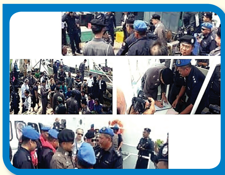
การตรวจร่วมทางทะเลอันดามันระหว่างเจ้าหน้าที่ฝ่ายไทยกับเจ้าหน้าที่ฝ่ายมาเลเซีย

นอกจากนี้ กองบังคับการตำรวจน้ำ มีการตรวจเรือประมง จำนวน 837 ลำ กองทัพเรือตรวจเยี่ยม / ตรวจค้น เรือประมงในทะเล ในพื้นที่รับผิดชอบของทัพเรือภาคที่ 1 – 3 จำนวน 9,590 ครั้ง