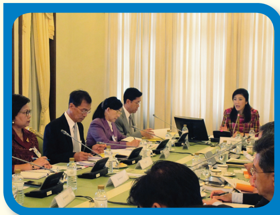
การประชุมคณะกรรมการป้องกันและปราบปรามการค้ามนุษย์