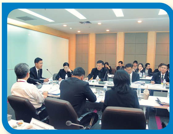
การประชุมคณะกรรมการประสานและกำกับการดำเนินงานป้องกันและปราบปรามการค้ามนุษย์