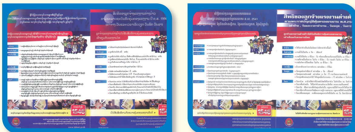
แผ่นพับ 4 ภาษา ไทย ลาว เมียนมา และกัมพูชา