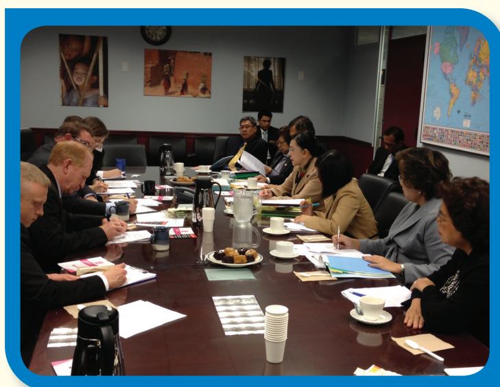
การประชุมหารือระหว่างรัฐมนตรีว่าการกระทรวงการพัฒนาสังคมและความมั่นคงของมนุษย์ กับเอกอัครราชทูต Luis CdeBaca