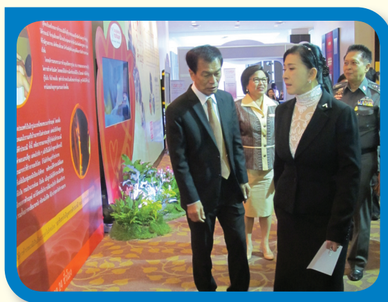
งานรณรงค์ต่อต้านการค้ามนุษย์ ประจำปี 2556