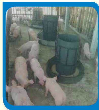
การสนับสนุนประกอบอาชีพเลี้ยงโคและสุกร จังหวัดร้อยเอ็ด