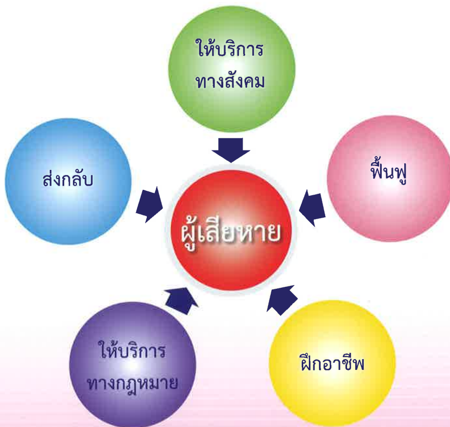
แผนภาพที่ ๖ กระบวนการคุ้มครองผู้เสียหาย