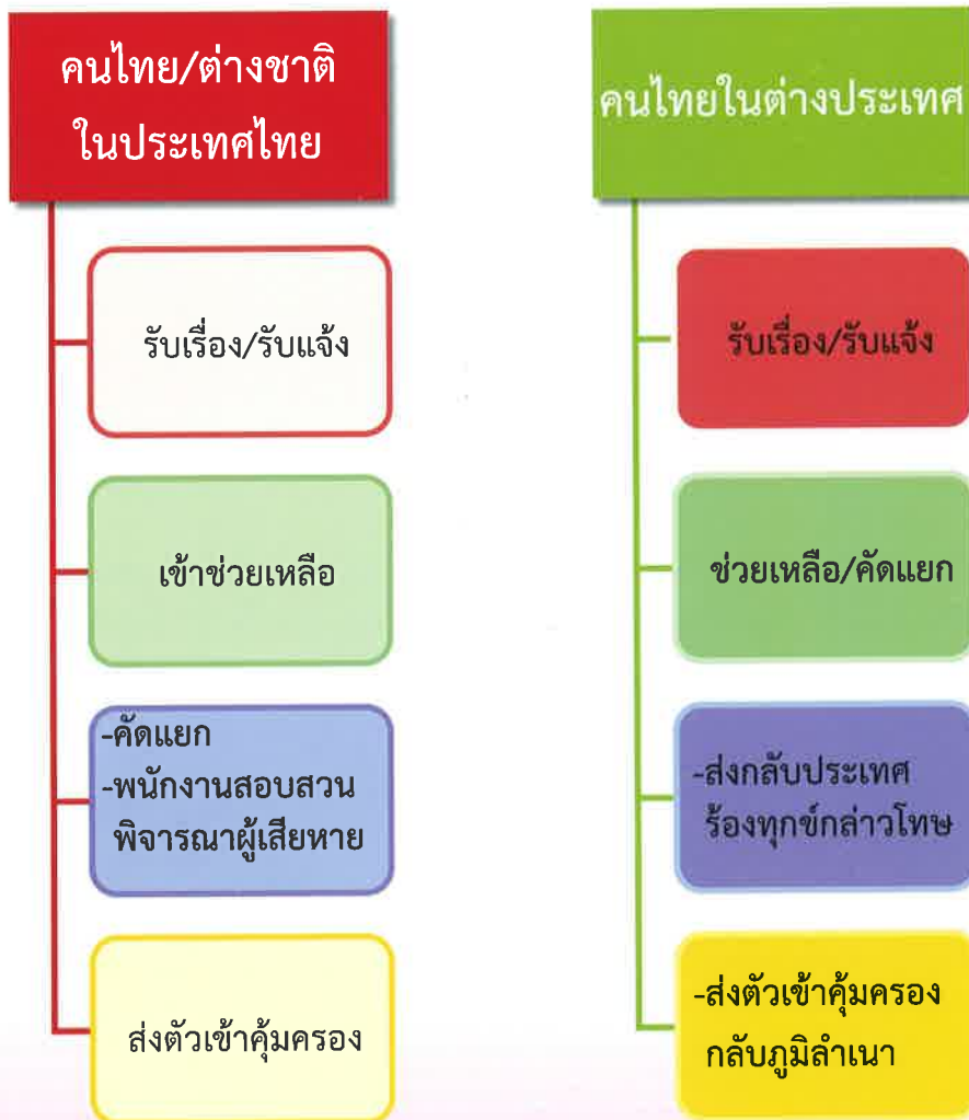
แผนภาพที่ ๔ การช่วยเหลือผู้เสียหาย

สำหรับคนไทยในต่างประเทศ จะได้รับการช่วยเหลือทั้งจากองค์การระหว่างประเทศ ชุมชนคนไทย และสถานเอกอัครราชทูต/สถานกงสุลใหญ่ เช่น กรมสอบสวนคดีพิเศษได้ร่วมมือกับสถานเอกอัครราชทูตสมาพันธรัฐสวิสประจำประเทศไทย ในการสืบสวนกรณีหญิงไทยถูกนายหน้าค้ามนุษย์ชาวไทยร่วมกับคนสวิส หลอกลวงไปค้าประเวณีที่สวิตเซอร์แลนด์และถูกข่มขืนกระทำชำเรา และในกรณีได้รับการช่วยเหลือแล้ว จะได้รับการคัดแยกเพื่อส่งกลับประเทศไทยในฐานะผู้เสียหายจากการค้ามนุษย์ (แผนภาพที่ ๔) โดยหน่วยงานของรัฐ หรือผู้เสียหายสามารถร้องทุกข์กล่าวโทษต่อพนักงานสอบสวน เพื่อให้ดำเนินคดีกับผู้กระทำผิดในประเทศไทย ในกรณีการกระทำความผิดเกิดขึ้นนอกราชอาณาจักร เนื่องจากพระราชบัญญัติป้องกันปราบปรามการค้ามนุษย์ พ.ศ. ๒๕๕๑ กำหนดให้ผู้กระทำความผิดนอกราชอาณาจักรต้องรับโทษในประเทศไทย ซึ่งอัยการสูงสุดเป็นพนักงานสอบสวนผู้รับผิดชอบและผู้ประสานงานกลาง (Central Authority) ในการดำเนินการส่งตัวผู้ร้ายข้ามแดน และความร่วมมือทางอาญาระหว่างประเทศ ตามกฎหมายและสนธิสัญญาระหว่างประเทศในเรื่องดังกล่าว