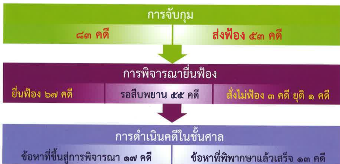
แผนภาพที่ ๕ จำนวนคดีจากการพิจารณา ปี ๒๕๕๔

ทั้งนี้ ในการดำเนินคดี ผู้ต้องหาได้รับสิทธิประกันตัว ซึ่งเป็นสิทธิในกระบวนการยุติธรรม ตามที่รัฐธรรมนูญฯ กำหนดไว้ในมาตรา ๓๙ และในชั้นการพิจารณาของศาล จะมีการแต่งตั้งล่ามของศาลในกรณีที่พยานไม่สามารถสื่อสารภาษาไทย ซึ่งล่ามมีข้อจำกัด คือ ความไม่ชำนาญในการใช้ภาษาของผู้เสียหายสื่อสาร และความไม่เข้าใจสาระเนื้อหาของรูปคดีการค้าย แต่จำเลยสามารถคัดค้านล่ามที่ศาลตั้งได้ในการพิพากษาลงโทษจำเลยซึ่งอาจมีความผิดพลาดหลายประการจะพิพากษาลงโทษความผิดสูงสุดตามพระราชบัญญัติป้องกันและปราบปรามการค้าย พ.ศ. ๒๕๕๑ เช่น ตัดสินจำคุก ตามคดีแดงเมื่อปี ๒๕๕๔ มีคดีโทษจำคุกสูงสุด ๑๔ ปี และปรับสูงสุด ๑๑๒,๐๐๐ บาท นอกจากนั้น มีคดีแดงที่ ๖๑/๕๔ พิพากษา เมื่อวันที่ ๘ มิถุนายน ๒๕๕๔ ซึ่งผู้กระทำผิดอายุ ๑๖ ปี จึงลดโทษให้กึ่งหนึ่ง ตามประมวลกฎหมายอาญา มาตรา ๗๕ ฐานร่วมกันพรากผู้เยาว์อายุกว่า ๑๕ ปี แต่ยังไม่เกิน ๑๘ ปี ซึ่งศาลพิเคราะห์รายงานของสถานพินิจและคุ้มครองเด็กและเยาวชนแล้ว เห็นว่าจำเลยกระทำความผิดเพราะเยาว์วัย จึงเปลี่ยนโทษจำคุกเป็นการส่งตัวจำเลยไปควบคุมเพื่อฝึกอบรมยังศูนย์ฝึกและอบรมเด็กและเยาวชนหญิงบ้านปรานี