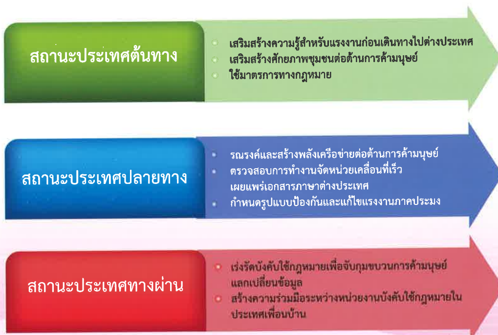
แผนภาพที่ ๒ ระบบการป้องกัน

มีการจัดมาตรการการป้องกันตามสถานะของประเทศไทยในกระบวนการค้ามนุษย์ (แผนภาพ ที่ ๒) กล่าวคือ ในสถานะประเทศต้นทาง ประเทศปลายทาง และประเทศทางผ่าน เพื่อเข้าถึงแต่ละกลุ่มเป้าหมายที่เป็นกลุ่มเสี่ยง และดำเนินงานซึ่งจะรับผิดชอบโดยหน่วยงานต่างๆ โดยการสนับสนุนจากเครือข่ายทุกภาคส่วน เพื่อขจัดความซ้ำซ้อนและครอบคลุมกลุ่มเป้าหมายมากขึ้น