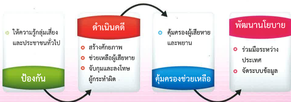
แผนภาพที่ ๑ กระบวนการปฏิบัติการป้องกันและปราบปรามการค้ำมนุษย์

มีการบังคับใช้พระราชบัญญัติป้องกันและปราบปรามการค้ำมนุษย์ พ.ศ. ๒๕๕๑ ผ่านกลไกระดับชาติในการกำหนดแผนปฏิบัติการป้องกันและปราบปรามการค้ำมนุษย์ ประจำปี และกลไกระดับจังหวัดสำหรับแผนปฏิบัติการฯ จังหวัดประจำปี เพื่อให้เกิดประสิทธิผลในการทำงานระหว่างหน่วยงานราชการทั้งราชการส่วนกลาง ราชการส่วนภูมิภาค และราชการส่วนท้องถิ่น และระหว่างหน่วยงานราชการ กับภาคธุรกิจโดยเฉพาะภาคประมง และการท่องเที่ยว โดยครอบคลุมการทำงานในด้านการป้องกัน (prevention) การดำเนินคดี (prosecution) การคุ้มครอง (protection) และการพัฒนานโยบาย (policy) แผนภาพที่ ๑ ซึ่งผลการดำเนินงานแต่ละด้านมี ดังนี้