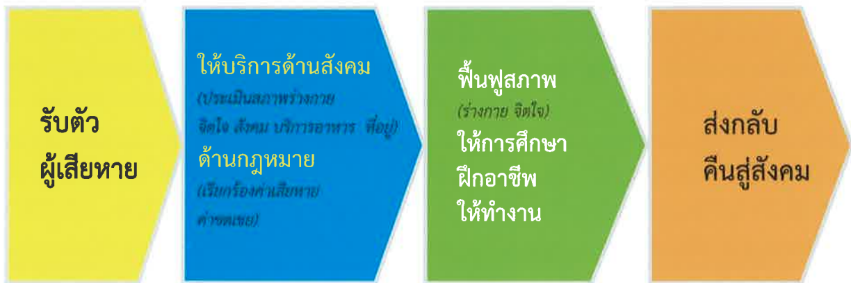
แผนภาพที่ ๔ การค้ำครองผู้เสียหายจากกระบวนการค้ำมนุษย์

กล่าวได้ว่า การให้ความค้ำครองผู้เสียหายชาวต่างชาติ ยังต้องอาศัยความร่วมมือในรูปแบบต่างๆ จากประเทศต้นทางในการดำเนินการรับกลับโดยเร็ว และปลอดภัย อาทิ บันทึกความเข้าใจ (MOU) กับประเทศ สปป. ลาว การประชุม case management กับประเทศพม่า