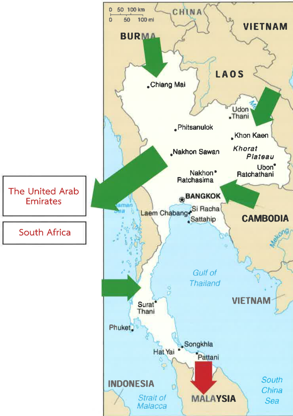
แผนภาพที่ ๑ เส้นทางการค้ามนุษย์

➡ ประเทศปลายทาง (เส้นทางจากต่างประเทศมาประเทศไทย)