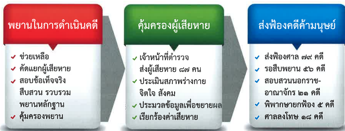
แผนภาพที่ ๓ ความเชื่อมโยงระหว่างการดำเนินคดีและการคุ้มครอง

คนไทยในต่างประเทศซึ่งได้รับการช่วยเหลือจากทั้งกระทรวงการต่างประเทศหรือองค์กรระหว่างประเทศ/องค์กรเอกชน และผ่านขั้นตอนการคัดแยกผู้เสียหาย จนกระทั่งได้รับการส่งกลับถึงท่าอากาศยานสุวรรณภูมิแล้ว ส่วนใหญ่จะไม่สมัครใจเข้ารับการคุ้มครองในสถานคุ้มครองจึงไม่มีการสัมภาษณ์ตามแบบประเมินหรือสอบข้อเท็จจริง หรือแจ้งความดำเนินคดี ซึ่งจะเป็นคดีนอกราชอาณาจักร อีกทั้ง มิได้มีการบันทึกหรือสัมภาษณ์เพื่อใช้ขยายผล และแรงงานไทยบางกลุ่มถูกส่งกลับเพราะถูกแสวงหาประโยชน์ตามกฎหมายบางประเทศ เช่น สหรัฐอเมริกา จากการจ่ายค่านายหน้าสูง แต่เมื่อกลับประเทศไทยแล้วไม่ผิดกฎหมายไทยเนื่องจากเป็นความยินยอมของผู้ที่คาดว่าอาจตกเป็นผู้เสียหาย